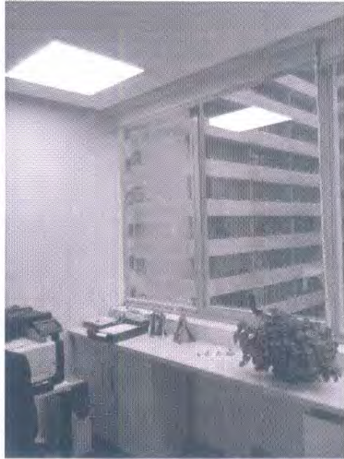
3 Oficinas- Sala de Reuniones