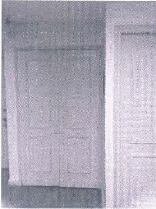
Hall – Área Secretaria