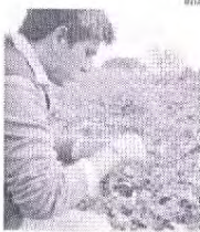
DESTACAN APORTE DEL PLAN.