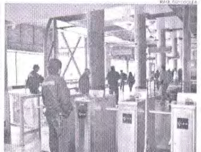
EL SISTEMA ESTÁ INSTALADO EN LAS ESTACIONES PUERTO Y LIMACHE.

Respecto al déficit del Parque, el personero precisó que la auditoría en curso de Contraloría "determinará responsabilidades respecto al déficit, que corresponden a solicitudes de crédito que no estarían debidamente autorizadas, lo que deberá establecer el órgano controlador", para luego avanzar en la recuperación de los recursos faltantes a través de distintas acciones. También se apunta a generar alianzas corporativas con socios estratégicos o empresas para desarrollar programas culturales, todo lo cual queda supeditado al resultado de la auditoría.