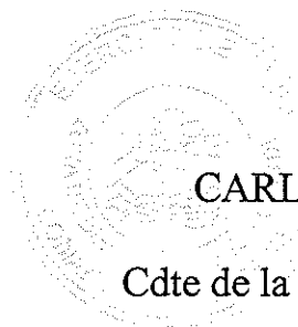
CARLOS ZOPPI PIMENTEL Teniente Coronel Cdte de la Zona de Btar. "Antofagasta"