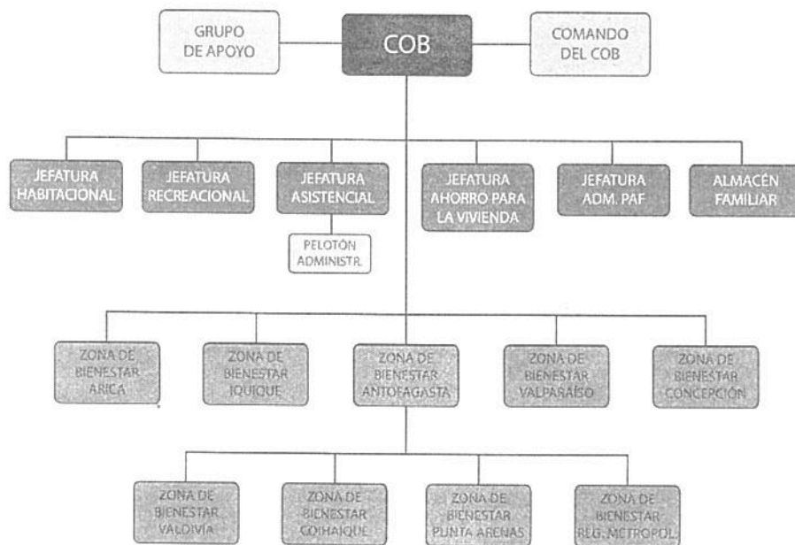
Fig. 9 Organigrama del Comando.