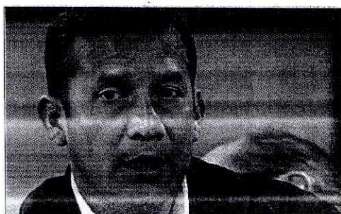
Candidato presidencial peruano, Ollanta Humala.

que "las relaciones internacionales están a cargo del canciller de la República y del Presidente. Nosotros tenemos que seguir esa línea. No debemos aprovechar sentimientos