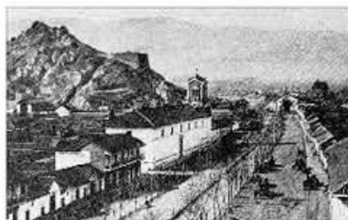
El antiguo monasterio de las Clarisas estaba emplazado en los terrenos donde hoy está la Biblioteca Nacional. A fines del siglo XVIII, se trasladó que este recinto, en Santiago, concentraba unas cuatrocientas personas.