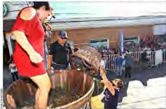
El pisoneo de la uva es la forma tradicional para sacar el jugo con que se elaboran los vinos. Esta antigua técnica campesina se denomina zarilla.

La acción de voluntarios salvó varias viñas de las llamas, así que los organizadores del evento decidieron devolver la mano y donaron parte de las ganancias a la institución.