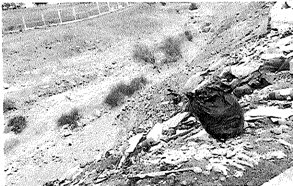
EN DISTINTOS SECTORES DEL LECHO DEL RÍO LA BASURA SE HA VUELTO A ACUMULAR CONVIRTIENDO AL SECTOR EN UN VERTEDERO.

"Acá incluso hay restaurantes que tienen la orilla del río como un basurero propio, botan de todo ahí. Lo otro es que pasan perros y las bolsas que dejan, ellos las dan vueltas y sacan todo lo que hay