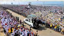
Una multitud de fieles se congregó en Trujillo para recibir al papa Francisco.