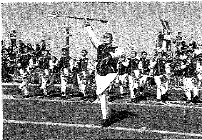
ALGUNOS DE LOS PARTICIPANTES EN EL DESFILE SON DE LA ESCUELA DE IQUIQUE.

"Es una gran responsabilidad que se tiene porque si uno se equivoca, se equivocan todos y el hecho de tener responsabilidad es un orgullo", comentó antes de regresar a su colegio.