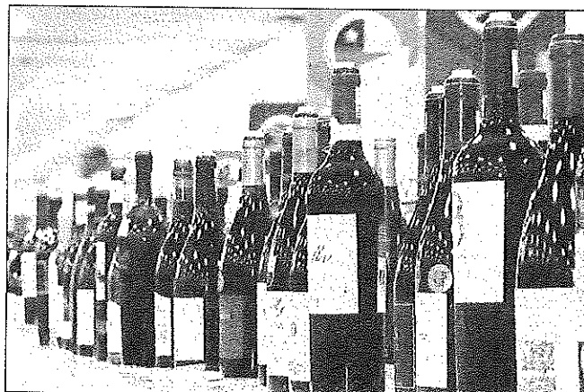
Las exportaciones de vino chileno embotellado alcanzaron en volumen los 12,5 millones de cajas durante los primeros tres meses de 2018.

En cuanto a los principales destinos del vino embotellado chileno, en los primeros tres