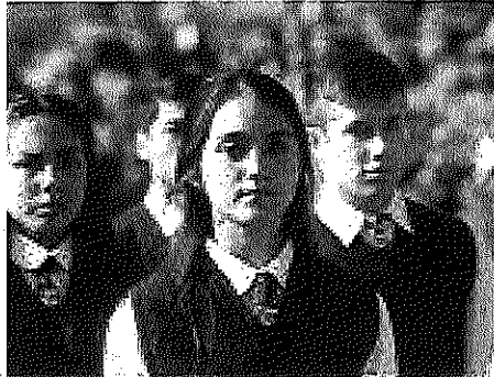
MUCHOS DE LOS PARTICIPANTES EN EL DESFILE SON DE LA ESCUELA DE IQUIQUE.