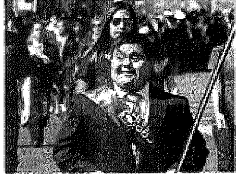
ALGUNOS DE LOS PARTICIPANTES EN EL DESFILE SON DE LA ESCUELA DE IQUIQUE.