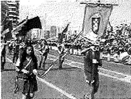
DURANTE EL DESFILE, LOS PARTICIPANTES EN IQUIQUE.