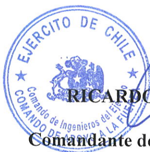
RICARDO CUBILLOS SINKOVICH Coronel Comandante de Ingenieros del Ejército Subrog.