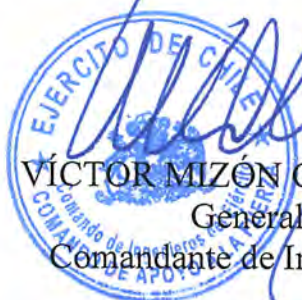
VÍCTOR MIZÓN GARCÍA-HUIDOBRO General de Brigada Comandante de Ingenieros del Ejército

El presente contrato se extiende en 5 (cinco) ejemplares de idéntico tenor, data y validez, quedando 4 (cuatro) copias en poder del mandante y 1 (uno) en poder del contratista. En comprobante y previa lectura, firman: