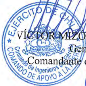
VÍCTOR MIZÓN GARCÍA-HUIDOBRO General de Brigada Comandante de Ingenieros del Ejército