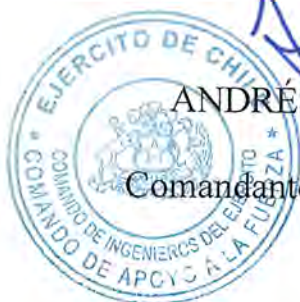
ANDRÉS CÁCERES CUADRA Coronel Comandante de Ingenieros del Ejército Suplente

El presente contrato se extiende en 5 (cinco) ejemplares de idéntico tenor, data y validez, quedando 4(cuatro) copias en poder del mandante y 1 (uno) en poder del contratista. En comprobante y previa lectura, firman: