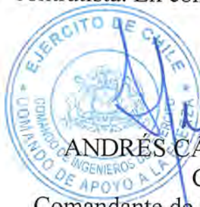
ANDRÉS CÁCERES CUADRA Coronel Comandante de Ingenieros del Ejército Subrogante

El presente contrato se extiende en 5 (cinco) ejemplares de idéntico tenor, data y validez, quedando 4(cuatro) copias en poder del mandante y 1 (uno) en poder del contratista. En comprobante y previa lectura, firman: