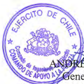
ANDRÉS SILVA VEGA General de Brigada Comandante de Ingenieros del Ejército

El presente contrato se extiende en 5 (cinco) ejemplares de idéntico tenor, data y validez, quedando 4(cuatro) copias en poder del mandante y 1 (uno) en poder del contratista. En comprobante y previa lectura, firman: