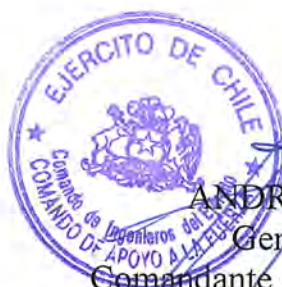
ANDRÉS SILVA VEGA General de Brigada Comandante de Ingenieros del Ejército

El presente contrato se extiende en 5 (cinco) ejemplares de idéntico tenor, data y validez, quedando 4 (cuatro) copias en poder del mandante y 1 (uno) en poder del contratista. En comprobante y previa lectura, firman: