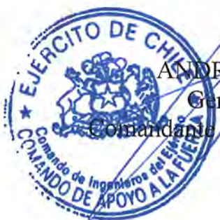
ANDRÉS SILVA VEGA General de Brigada Comandante de Ingenieros del Ejército

El presente contrato se extiende en 5 (cinco) ejemplares de idéntico tenor, data y validez, quedando 4 (cuatro) copias en poder del mandante y 1 (uno) en poder del contratista. En comprobante y previa lectura, firman: