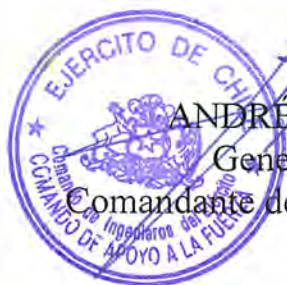
ANDRÉS SILVA VEGA General de Brigada Comandante de Ingenieros del Ejército

El presente contrato se extiende en 5 (cinco) ejemplares de idéntico tenor, data y validez, quedando 4(cuatro) copias en poder del mandante y 1 (uno) en poder del contratista. En comprobante y previa lectura, firman: