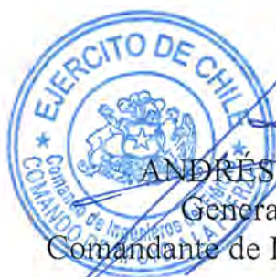
ANDRÉS SILVA VEGA General de Brigada Comandante de Ingenieros del Ejército

El presente contrato se extiende en 5 (cinco) ejemplares de idéntico tenor, data y validez, quedando 4 (cuatro) copias en poder del mandante y 1 (uno) en poder del contratista. En comprobante y previa lectura, firman: