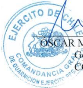
ÓSCAR MEZZANO ESCANILLA General de Brigada CGGERM - MHM