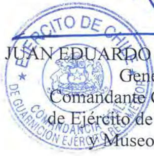
JUAN EDUARDO GONZÁLEZ FUENTEALBA General de División Comandante General de la Guarnición de Ejército de la Región Metropolitana y Museo Histórico y Militar