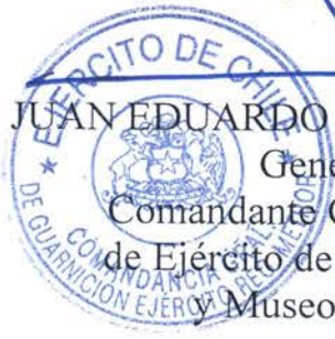
JUAN EDUARDO GONZÁLEZ FUENTEALBA General de División Comandante General de la Guarnición de Ejército de la Región Metropolitana y Museo Histórico y Militar